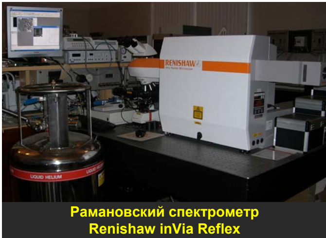
Рамановский спектрометр Renishaw inVia Reflex