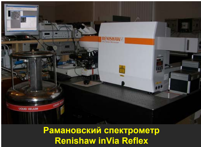
Рамановский спектрометр Renishaw inVia Reflex