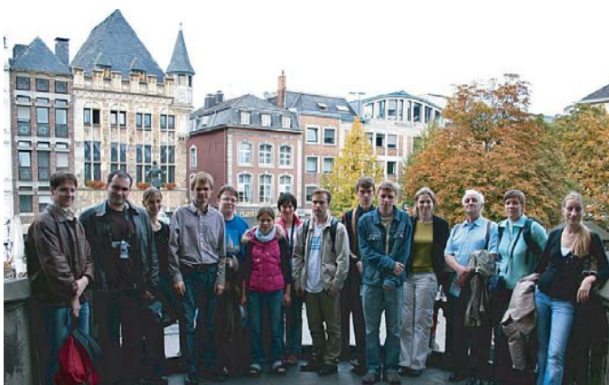
Студенты ФНМ в г. Бохуме (Германия)