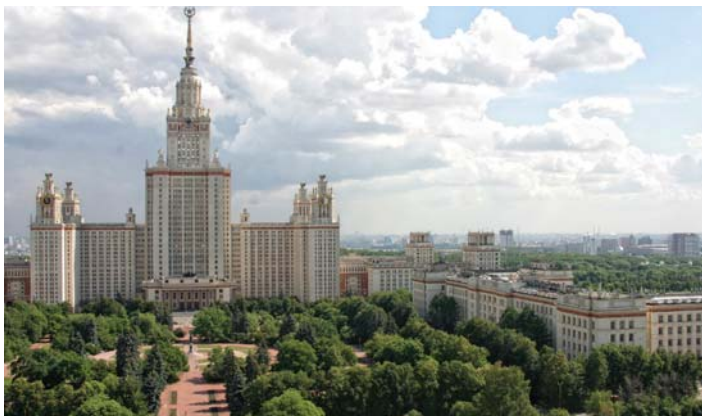
Главное здание МГУ и здание физического факультета

Материал подготовлен по данным информагентств