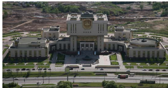
Здание Интеллектуального центра — Фундаментальной библиотеки МГУ, в котором располагается и Музей истории МГУ

В структуре отдела общежитий три сектора: ДСВ (пр-т Вернадского, 37), ДАС (ул. Шверника, 19) и ФДС (Ломоносовский пр-т, 31). Фонд отдела включает около 100 тыс. экземпляров.