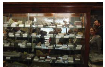
В Музее землеведения

стоянно пополняются. В фондах представлены архивные материалы, фотографии, книги, произведения живописи и скульптуры, личные вещи работников университета, предметы обихода, которые со временем приобрели культурную значимость и стали частью истории МГУ. Важным оказалось участие музея в подготовке мероприятий и выставок, посвященных празднованию 250-летия Московского университета в Государственном Историческом музее и в Интеллектуальном центре. Музей истории МГУ открыт с понедельника по пятницу с 10 до 17.