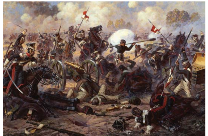
Фрагмент изображения из музея-панорамы «Бородинская битва»

Учредитель — МГУ имени М.В. Ломоносова. Лицензия № 021354 от 21.07.1999 г. Газета «Московский университет». Издатель — Центр СМИ МГУ. Рег. номер в Министерстве печати и информации: 498 от 15.10.1990 г.