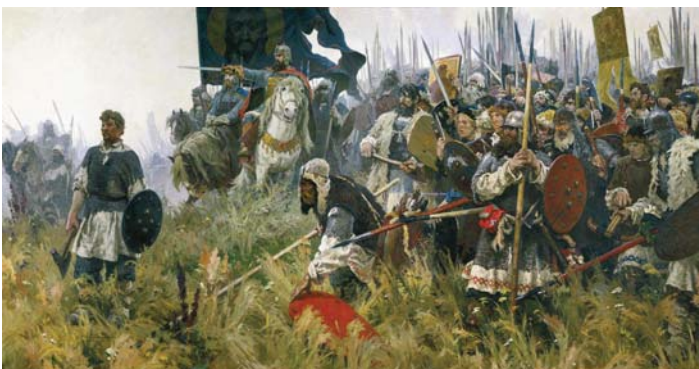
А.П. Бубнов. Утро на Куликовом поле