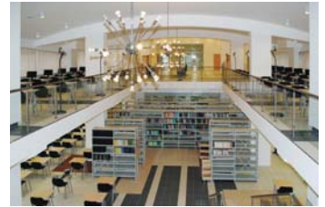
Открытый 1 сентября 2010 года новый читальный зал экономичного факультета.

Кроме того, в систему Научной библиотеки МГУ входит отдел Центра международного образования, отдел абонемента рабочих и служащих, отдел хранения периодических изданий и отдел общежитий.