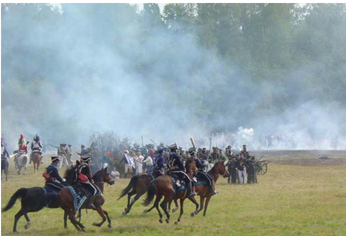
Бородино. Сражение. Московский фотоальбом.