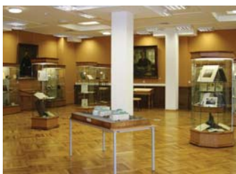
Экспозиция Музея истории МГУ

Какой вопрос возникает одним из первых перед человеком, ставшим студентом Московского университета? Звучать он может примерно так: «А что находится в центральной «башенке» Главного здания?».